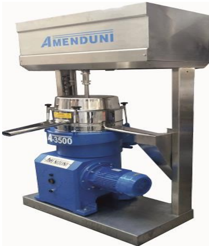
Figure 7 : Séparateur A-3500 à décharge automatique

Centrifugeuse verticale pour l'éclaircissement de l'huile par l'élimination des éventuelles particules solides et gouttes d'eau.